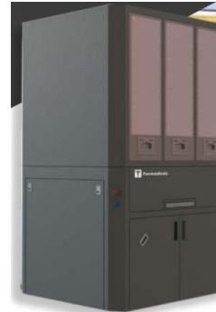
Nueva FARMA-serie-Z POUCH Made in Spain