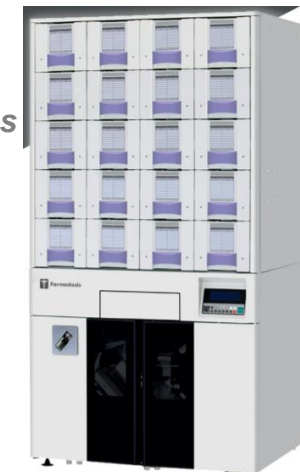
Farmasonic 320-480 Tolvas