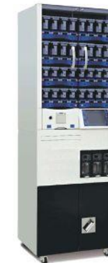
FARMA 92 L (hasta agotar existencia)