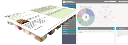
BLISTER ONE + AMCO