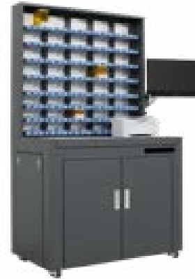
FARMA-Z-80B 80 tolvas