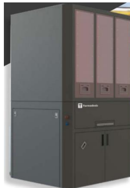
Nueva FARMA-serie-Z POUCH Made in Spain